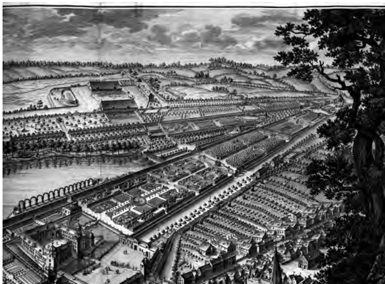
Abb. 1: Eutiner Schlossgarten nach Lewon.

(1606–1655) bekannt. Ab 1670 besaß Fürstbischof August Friedrich (1646–1705) um das Schloss herum einen eindrucksvollen Lust- und Blumengarten mit einem Broderieparterre nach holländischem Vorbild.