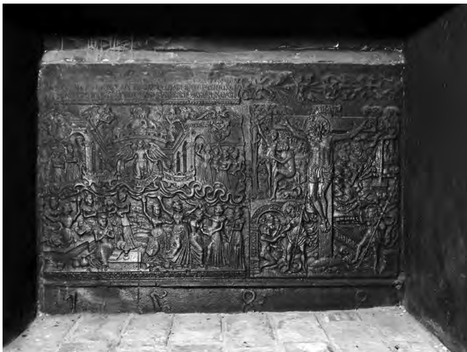
Abb.1: Ofenplatte Kaminrückwand.

fünf. In Kopenhagen ist die Platte noch an einem kompletten Ofen erhalten. Für die außergewöhnlich detailreiche Darstellung hat es eine ebenso detailreiche Vorlage gegeben. Diese finden wir bei Pieter Brueghel dem Älteren, geschaffen in der Mitte des 16. Jahrhunderts, also kurz vor unserem Plattenguss.