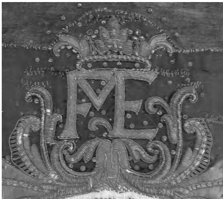
Abb. 6: Medaillon 1 – Monogramm FME.

chen und war musikalisch aktiv. Nachdem sie nach Schleswig gekommen war, begann dort der Umgestaltungsprozess zu einem repräsentativen barocken Fürstenhof. Sie selbst beschäftigte zahlreiche Gold- und Silberschmiede. Außerdem sammelte sie wie ihr Mann und sein Bruder Hans Uhren und astronomische Instrumente. Nach dem Tod ihres Mannes zog sich Maria Elisabeth 1660 auf ihr Wittum Schloss Husum zurück, nachdem sie ihrem erst 18jährigen Sohn Christian Albrecht noch ein Jahr bei seinen Regierungsgeschäften zur Seite gestanden hatte. Zuvor waren hier während des Wittums ihrer Schwiegermutter Herzogin Augusta bereits auch ihr Mann Friedrich und sein Bruder Hans im protestantischen Sinne erzogen worden.