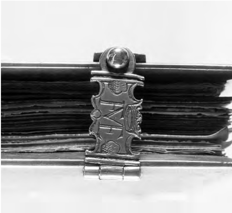
Abb. 7: Schließe Andachtsbuch.