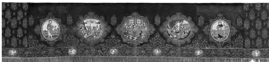
Abb. 4: Antependium komplett.

Das Antependium im Eutiner Schloss ist einzigartig in seinem liturgischen Kontext, den Geschichten, die es erzählt, in seiner künstlerischen Gestaltung und seiner handwerklichen Vollendung. Erstaunlicherweise ist in der Öffentlichkeit kaum etwas über die Bedeutung bekannt. Auch in der Literatur fallen die Erwähnungen eher bescheiden aus. 23 Kein anderes bekanntes Antependium zeigt ein solch reichhaltiges und kunstvolles Bildprogramm.