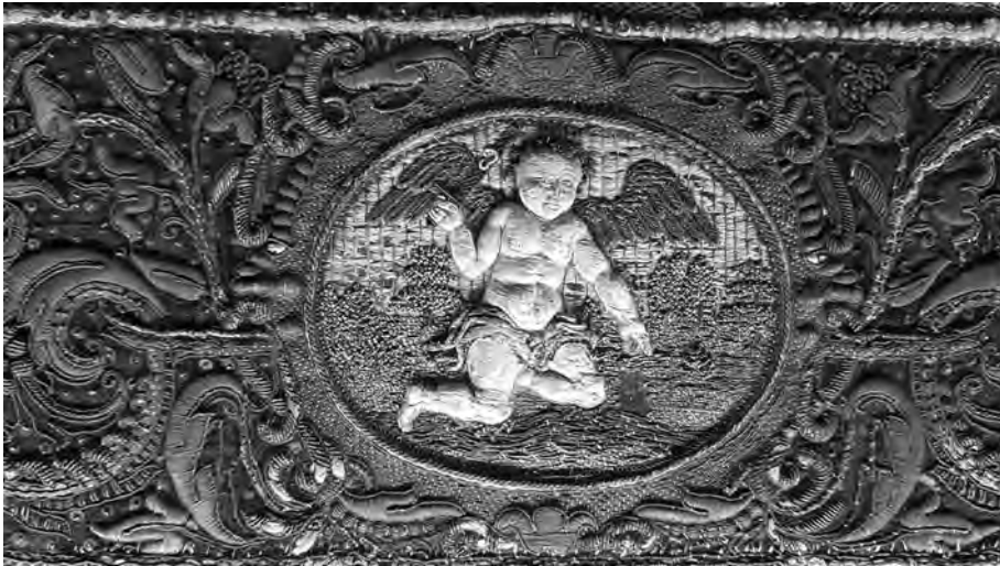
Abb. 5: Engelmedaillon.

Der 4. Engel ist mit der Kreuzesleiter dargestellt.