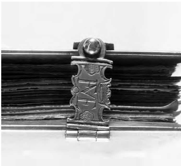
Abb. 7: Schließe Andachtsbuch.