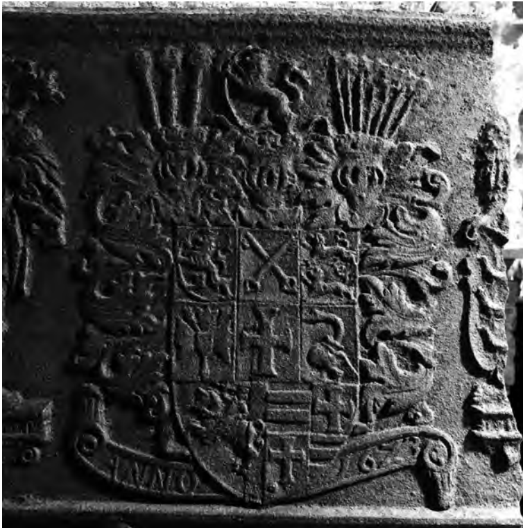
Abb. 3: Detail Wappen.

Über den ursprünglichen Standort dieses Ofens können wir nur Vermutungen anstellen. Dokumente über die Ausstattung der Räume in jener Zeit sind in keinen der zur Verfügung stehenden Archive nachzuweisen. Aufgrund seines kunstvollen Wappens und seiner außergewöhnlichen Größe ist zu vermuten, dass er in einem repräsentativen großen Raum, nämlich dem Rittersaal, gestanden hat.