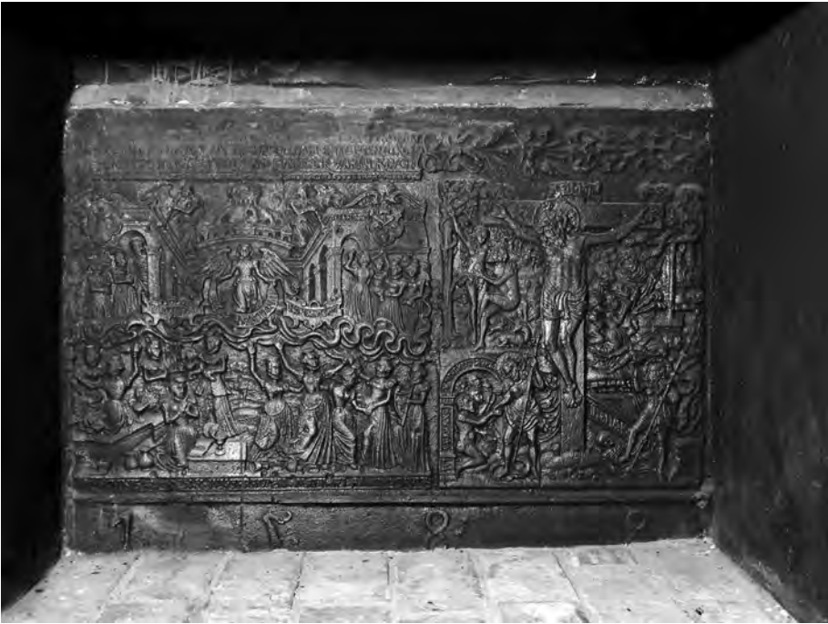
Abb.1: Ofenplatte Kaminrückwand.

fünf. In Kopenhagen ist die Platte noch an einem kompletten Ofen erhalten. Für die außergewöhnlich detailreiche Darstellung hat es eine ebenso detailreiche Vorlage gegeben. Diese finden wir bei Pieter Brueghel dem Älteren, geschaffen in der Mitte des 16. Jahrhunderts, also kurz vor unserem Plattenguss.