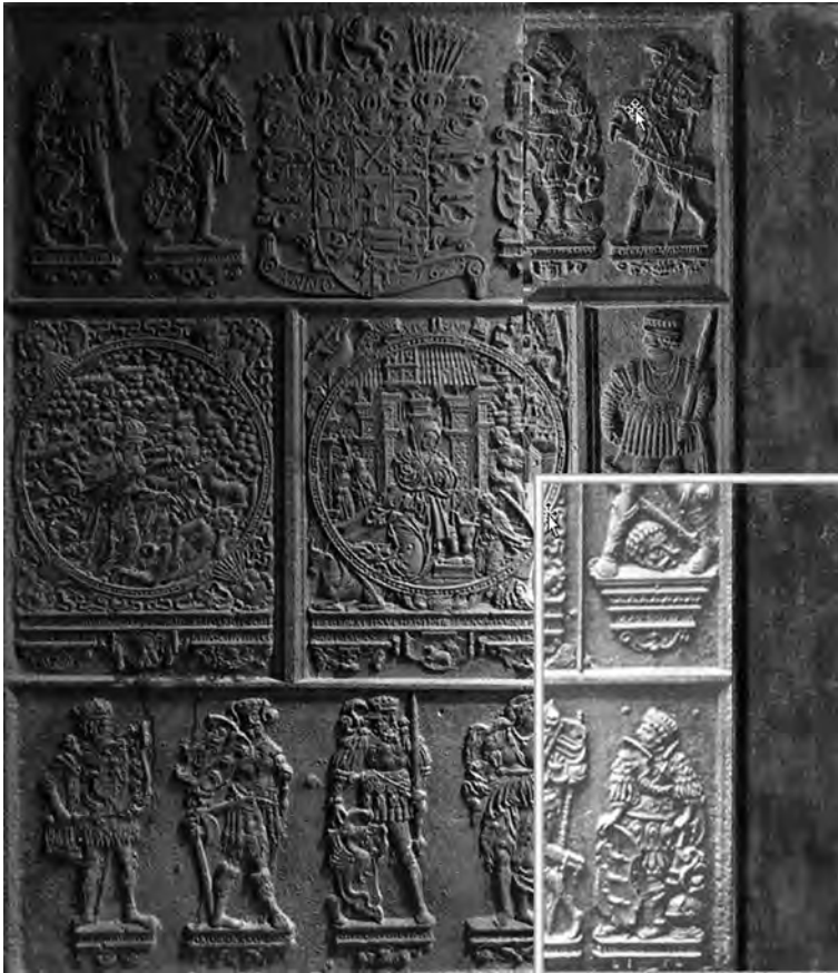
Abb. 2: große Platte (= Montage zweier Teile).