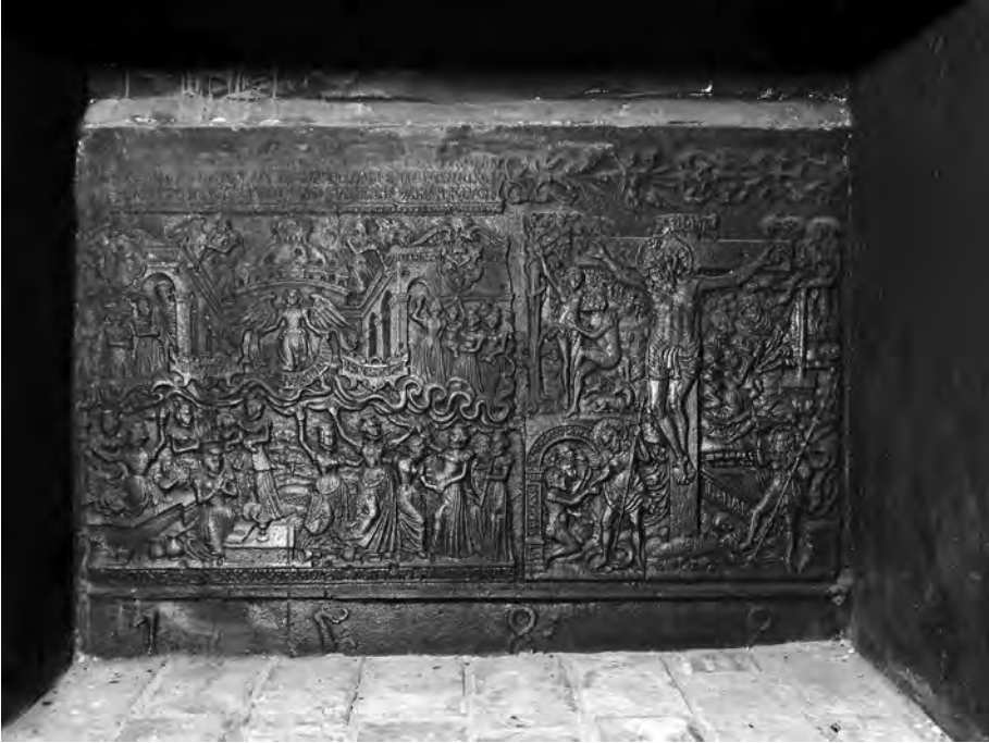
Abb.1: Ofenplatte Kaminrückwand.

fünf. In Kopenhagen ist die Platte noch an einem kompletten Ofen erhalten. Für die außergewöhnlich detailreiche Darstellung hat es eine ebenso detailreiche Vorlage gegeben. Diese finden wir bei Pieter Brueghel dem Älteren, geschaffen in der Mitte des 16. Jahrhunderts, also kurz vor unserem Plattenguss.