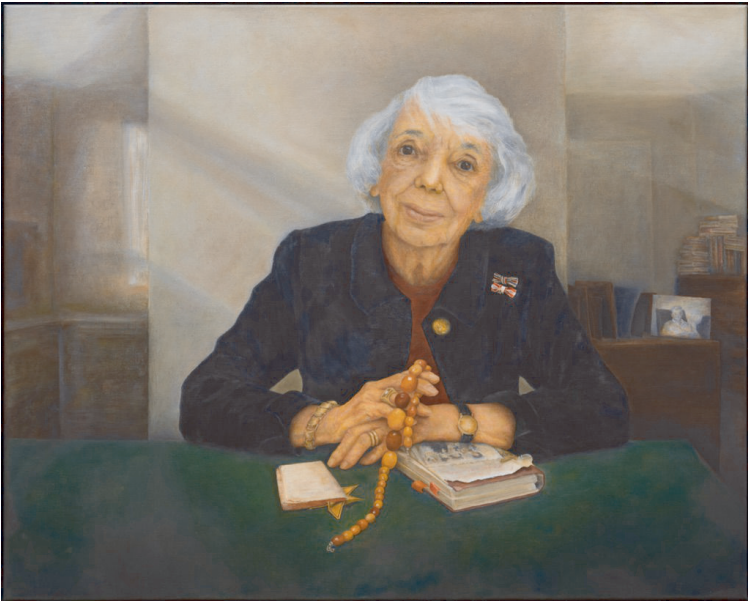
Margot Friedländer Ehrenbürgerin Portrait Öl auf Leinwand 2020 (S.v.D.)

Dies ist das einzig gemalte Grisaille-Portrait von Margot Bendheim (verh. Friedländer), bevor sie ihre Nase hat operieren lassen, um nicht als Jüdin erkannt zu werden. Zu dieser Zeit ließ sie auch ihre Haare Tizianrot färben.