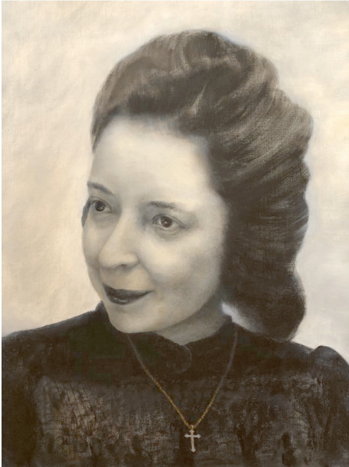
Grisaille Portrait 2021 Nach einem Photo a.d. Jahr 1943 Berlin Öl auf Leinwand 2021 (S.v.D.) Jetzt im Besitz des Jüdischen Museums Berlin

Mit 22 Jahren mußte Margot sich ab sofort allein zurechtfinden... Erst im nazibeherrschten Berlin, dann in Theresienstadt.