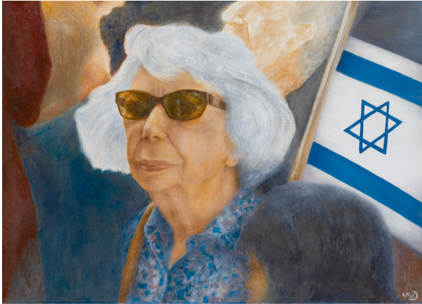
Demo auf dem Ku'damm Öl auf Leinwand 2021 (S.v.D.) Priv. Besitz