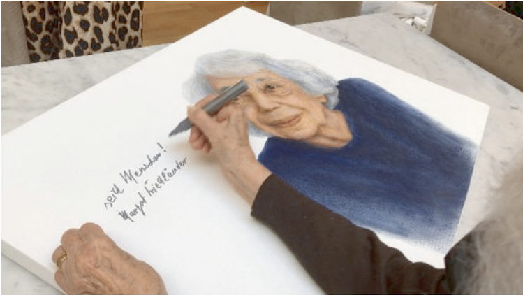
»Seid Menschen« Portrait M.F. Öl auf Leinwand 2022 M.F. eigene Handschrift m. Marker

Dieses Portrait ließ sich der heutige Eigentümer mit dem von Margot Friedländer stets in ihren Vorträgen und Reden wiederholten Aufruf: SEID MENSCHEN! beschriften.