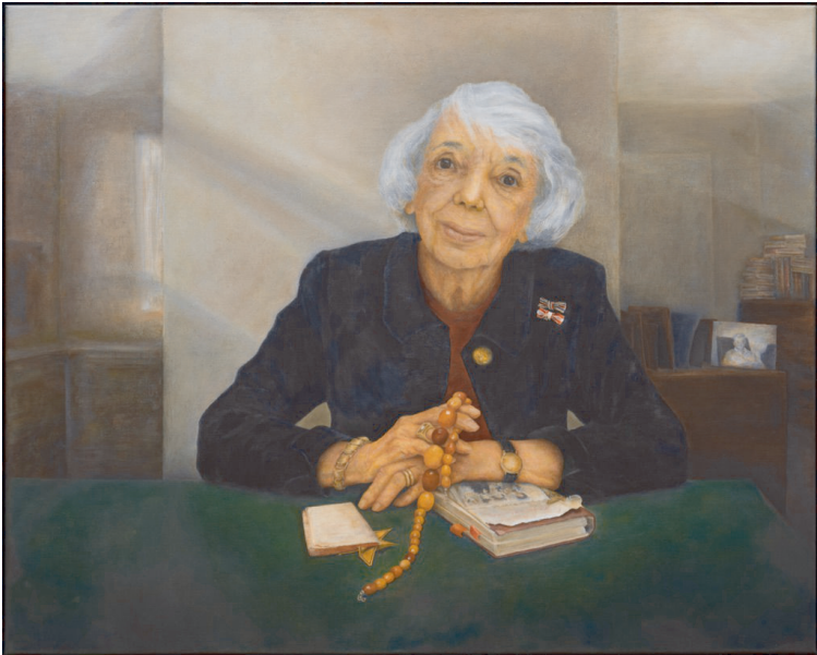
Margot Friedländer Ehrenbürgerin Portrait Öl auf Leinwand 2020

Dies ist das einzig gemalte Grisaille-Portrait von Margot Bendheim (verh. Friedländer), bevor sie ihre Nase hat operieren lassen, um nicht als Jüdin erkannt zu werden. Zu dieser Zeit ließ sie auch ihre Haare Tizianrot färben.