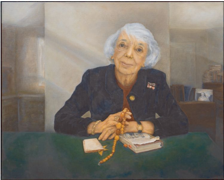
Margot Friedländer Ehrenbürgerin Portrait Öl auf Leinwand 2020

Dies ist das einzig gemalte Grisaille-Portrait von Margot Bendheim (verh. Friedländer), bevor sie ihre Nase hat operieren lassen, um nicht als Jüdin erkannt zu werden. Zu dieser Zeit ließ sie auch ihre Haare Tizianrot färben.