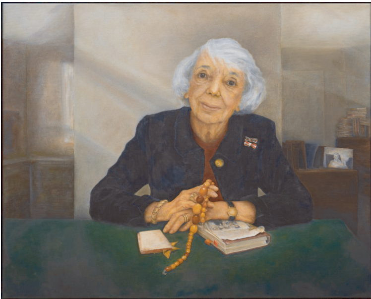
Margot Friedländer Ehrenbürgerin Portrait Öl auf Leinwand 2020

Dies ist das einzig gemalte Grisaille-Portrait von Margot Bendheim (verh. Friedländer), bevor sie ihre Nase hat operieren lassen, um nicht als Jüdin erkannt zu werden. Zu dieser Zeit ließ sie auch ihre Haare Tizianrot färben.