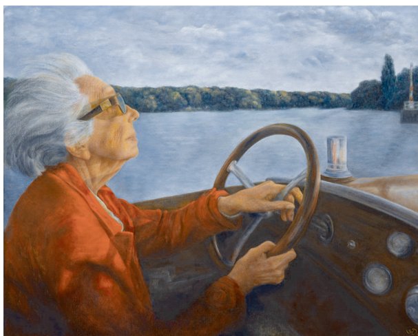
Leidenschaftlich im Boot am Steuer Öl auf Leinwand 2021 (S.v.D.) Priv. Besitz