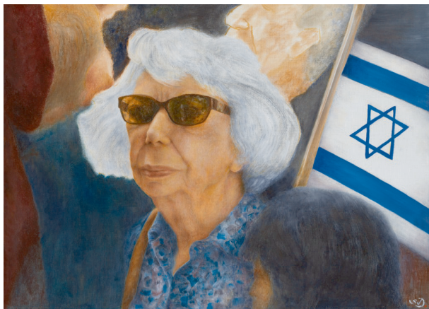
Demo auf dem Ku'damm Öl auf Leinwand 2021 (S.v.D.) Priv. Besitz