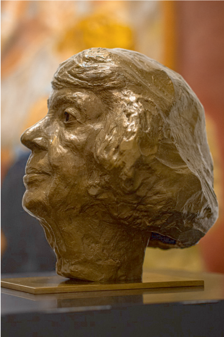
Margot Friedländer Bronze Büste (S.v.D.) Bildgiesserei Noack Besitz des Senats von Berlin, Rotes Rathaus