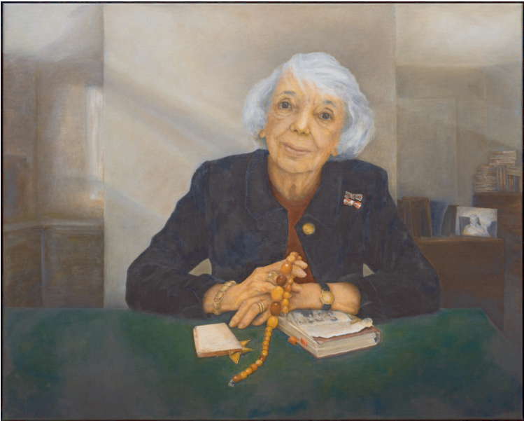
Margot Friedländer Ehrenbürgerin Portrait Öl auf Leinwand 2020

Dies ist das einzig gemalte Grisaille-Portrait von Margot Bendheim (verh. Friedländer), bevor sie ihre Nase hat operieren lassen, um nicht als Jüdin erkannt zu werden. Zu dieser Zeit ließ sie auch ihre Haare Tizianrot färben.