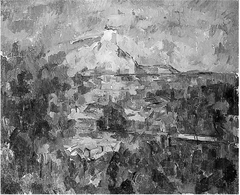
Paul Cézanne, La Montagne Sainte-Victoire. 1904/06 Öffentliche Kunstsammlung Basel, Kunstmuseum