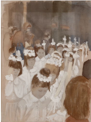
Eva Schwab, Der Kirchgang (2005; Privatbesitz)