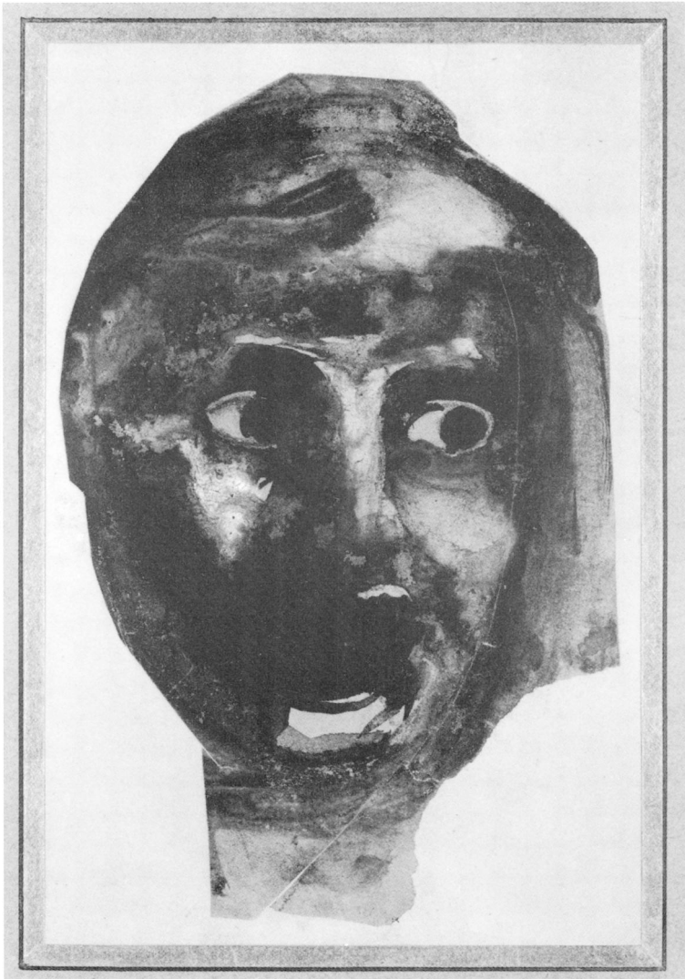
Auguste Rodin (1840–1917) · Das Haupt der Medusa, vor 1883 Schwarze Tusche über Bleistift und Kohle, weiß gehöht, auf gelbem Papier, ausgeschnitten, auf neue Unterlage geklebt, 16,2 × 10,4 cm (Kopf), 17,2 × 11 cm (Unterlage) KUPFERSTICHKABINETT · Staatliche Museen zu Berlin