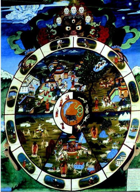
Bild 25: Das Rad des Lebens als Mandala, Wandmalerei in einem tibetischen Kloster (19./20. Jh.)

Die obenstehende Wandmalerei in einem tibetischen Kloster (19./20. Jh.) zeigt mit einem »Lebensrad« das Wesentliche der Lehre Buddhas, der in der Nacht vor seiner Erleuchtung den ewigen Kreislauf des Werdens und Vergehens sah. Das zwölfgliedrige »Gesetz des Entstehens in Abhängigkeit« zeigt, wie Leiden entsteht, aber auch überwunden werden kann. Die Glieder der Kette sind im äußeren hellen Kreis dargestellt. Es beginnt oben rechts 1. mit einer blinden Greisin, einer Allegorie auf Unwissenheit, dann folgen 2. über Tatabsichten (Töpfer, der seine Gefäße formt), 3. Bewusstsein (ein Affe springt auf einen fruchttragenden Baum), 4. Name und Körper bzw. Form (Mensch im Boot, im Lebensstrom treibend), 5. Sechssinnenreich (Häuser mit meistens sechs Fenstern), 6. Berührung: Liebespaar, 7. Empfindungen (Pfeil, der das Auge Menschen durchbohrt), 8. Gier (Trinker), 9. Ergreifen: Früchtesammler, 10. Werden: schwangere Frau und 11. Geburt sowie 12. Alter und Tod (Leichenträger). Die drei oberen Segmente im Inneren zeigen positive Möglichkeiten der Wiedergeburt (bei gutem Karma), und zwar