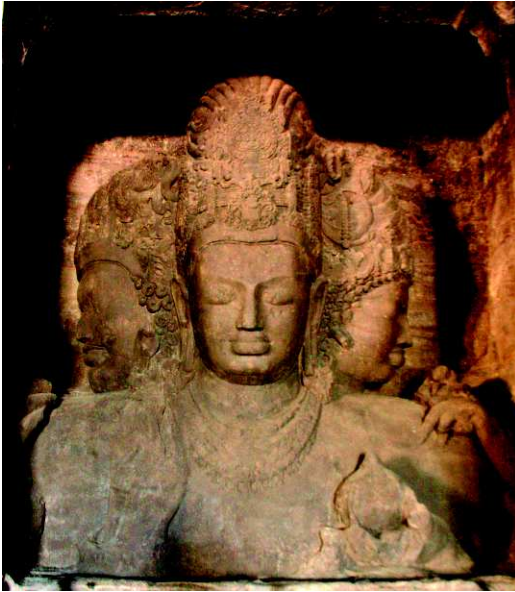
Bild 23: Trimurti-Skulptur, Elephanta Caves, Mumbai (5.–8. Jh. n. Chr.)

Traditionsschriften): Nun wurden als zentrale Gottheiten Brahma, Vishnu und Shiva verehrt und sind oft personalisiert dargestellt worden. (Ihnen vorgelagert ist noch Ishvara, der aber als schöpferisches Prinzip nicht in Erscheinung tritt.) Brahma, Vishnu und Shiva, die für Stoddart als »Betrachtungsweisen Gottes« aufgefasst werden können, 686 gelten als »Trimurti«, die Mall als »indische Dreifaltigkeit«, als »Hindutrinität« 687 bezeichnet. (Der Trinitätsgedanke trat nach Keilhauer aber schon sehr früh, in vedischer Zeit, auf 688 und kann keineswegs durch das frühe Christentum beeinflusst sein.)