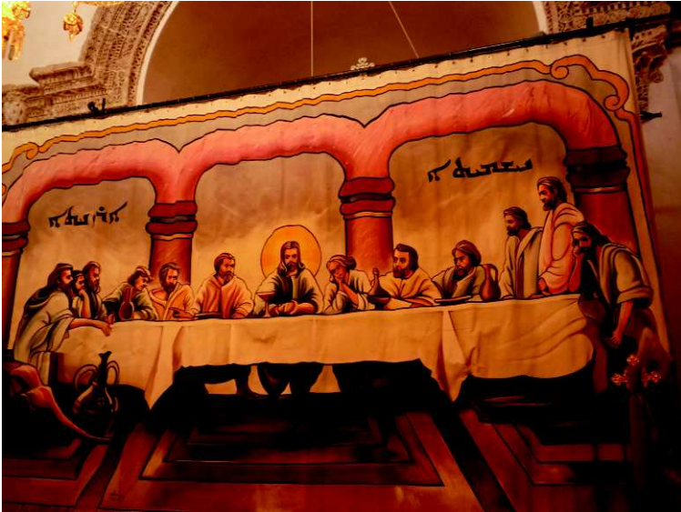
Bild 8: Syrisch-orthodoxe Ikonostase als Vorhang vor dem Altarraum

und enthüllt dann erst den Altarraum. Das obenstehende Foto aus dem christlichen Kloster Mor Gabriel in Südostanatolien ist ein historisches Dokument, denn im Juni 2016 enteignete die türkische Regierung alle christlichen Klöster und konfiszierte ihr Inventar.