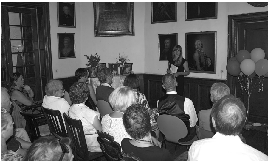
▲ Abschiedsfeier im Haus Schücking

ein Gehalt im Rechtsamt der Stadt Dortmund arbeitete. Als frisch gebackene Rechtsanwältin in der Nachkriegszeit erhielt sie nur wenige Mandate, hauptsächlich Ehescheidungen und Mietsachen, da der Anblick einer Anwältin nach den Jahren des NS-Regimes ungewöhnlich war.