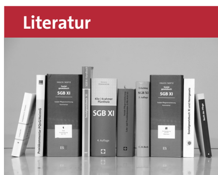
Drescher, R.: Großeinrichtungen: Alles in Bewegung, in: Sozialwirtschaft, 2/2017, Seite 11–14.

Was die Frage der Wirtschaftlichkeit anbetrifft, spielen die Auswirkungen auf die Personalkosten eine weitaus größere Rolle als etwa die im Rahmen dieser Ausführungen teilweise thematisierten Gebäudekosten. Hier gilt es noch weitreichende Forschungsdefizite aufzuarbeiten. Ein erstes einschlägiges Projekt wurde von Rolf Drescher in dieser Zeitschrift bereits zitiert und kritisiert. ■