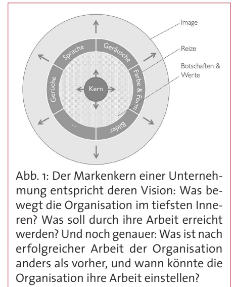
Abb. 1: Der Markenkern einer Unternehmung entspricht deren Vision: Was bewegt die Organisation im tiefsten Inneren? Was soll durch ihre Arbeit erreicht werden? Und noch genauer: Was ist nach erfolgreicher Arbeit der Organisation anders als vorher, und wann könnte die Organisation ihre Arbeit einstellen?

Während die Botschaften und Werte den Handlungsrahmen aller Aktivitäten der Organisation definieren, geht es in der nächsten Ebene des Image-Modells um die differenzierte Umsetzung und die Frage: Wo und wie machen wir die Marke wahrnehmbar? Hierfür ist zunächst eine Klarheit über die zentralen Kontaktpunkte der Organisation mit den Zielgruppen nötig. Daraufhin können