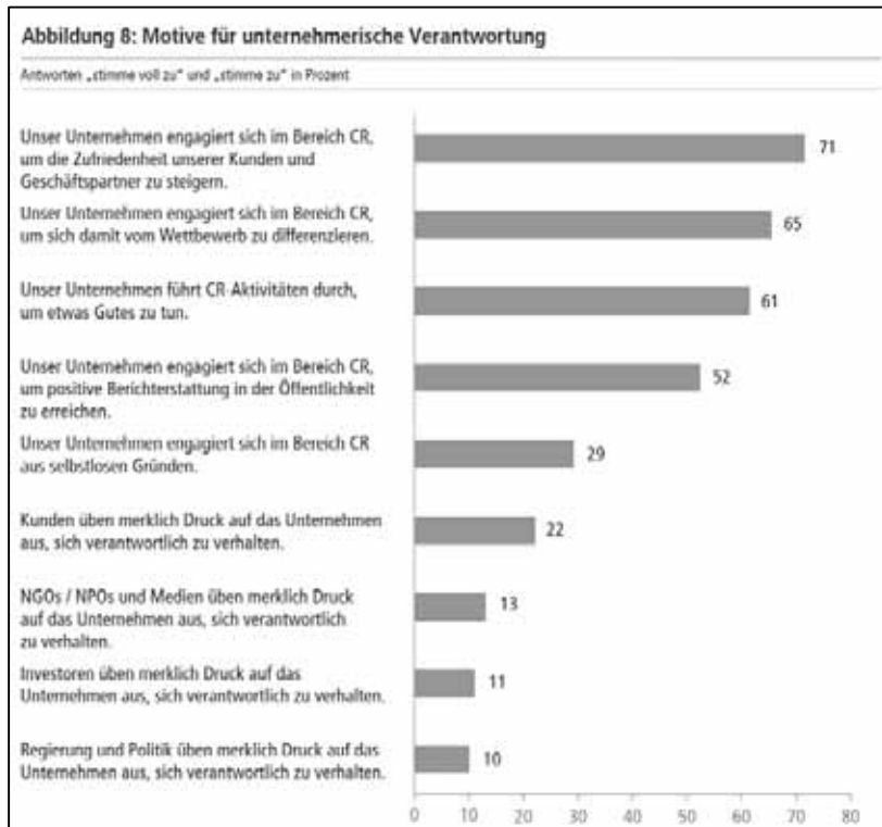
Abbildung 3: Motive für unternehmerische Verantwortung

Dass wiederum das Konzept der Freiwilligkeit hierfür der ausschlaggebende Grund ist, ist naheliegend. Nur jedes zehnte Unternehmen gibt politischen Druck als Motiv für unternehmerische Verantwortung an (vgl. Abbildung 3). Auch der Corporate Responsibility Index kommt zu diesem Schluss: „Insbesondere politischer Druck scheint kein wichtiger Motivationsgrund für CR-Engagement zu sein. Dies erklärt, weswegen die Politik zu den weniger bedeutsamen Stakeholdern gezählt wird“ (Bertelsmann Stiftung 2014: 29)