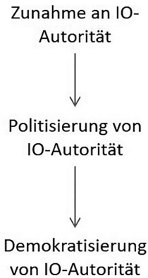
Abbildung 1: Das Standardnarrativ der Politisierungsforschung

Gemäß den Erwartungen des Standardnarrativs müssten die Voraussetzungen für eine Demokratisierung internationaler Organisationen heute besonders gut sein. Das Ausmaß an politischer Autorität, das in IOs durch Mehrheitsentscheidungen in intergouvernementalen Gremien gepoolt wird bzw. das IOs durch Übertragung an supranationale Organe delegiert wurde, ist auf einem historischen Höchststand (Hooghe et al. 2017; Zürn et al. 2017). Gleichsam, und in Übereinstimmung mit dem ersten Nexus, ist der Grad der Politisierung internationaler Organisationen in den vergangenen drei Jahrzehnten stark gewachsen (Zürn et al. 2012; Ecker-Ehrhardt 2018). Besonders autoritative IOs wie die Welthandelsorganisation (WTO), der Sicherheitsrat der Vereinten Nationen (UNSC) oder die EU, sind heute fortwährend Gegenstand öffentlicher Auseinandersetzungen. Anstatt jedoch, wie vom zweiten Nexus erwartet, Prozesse der Demokratisierung in IOs zu befördern, hat ihre Politisierung zuletzt vor allem zu nationalistischen Gegenbewegungen geführt. Der gesellschaftliche Rückhalt für die Abgabe nationaler Autorität an IOs schwindet (Bearce/Jolliff Scott 2019) und es kommt zu einer schleichenden Rücknahme von IO Autorität. Staaten ziehen sich aus internationalen Organisationen zurück und blockieren oder missachten ihr Regieren. Und dort, wo es zu weiteren Autori-