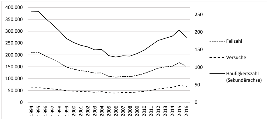
Abbildung 1: Entwicklung der Fallzahl und Häufigkeitszahl des Wohnungseinbruchdiebstahls (PKS 1994-2016).

Die Deliktentwicklung im Bereich Wohnungseinbruchdiebstahl war in den letzten Jahren in Deutschland von einem starken Anstieg der Fälle geprägt. Gemäß der Polizeilichen Kriminalstatistik betrug im Zeitraum 2006 bis 2015 die Zunahme von Wohnungseinbrüchen 57,52 %, wobei von 2015 zu 2016 seit Jahren erstmalig ein Rückgang um 9,5 % zu verzeichnen ist (siehe Abbildung 1).