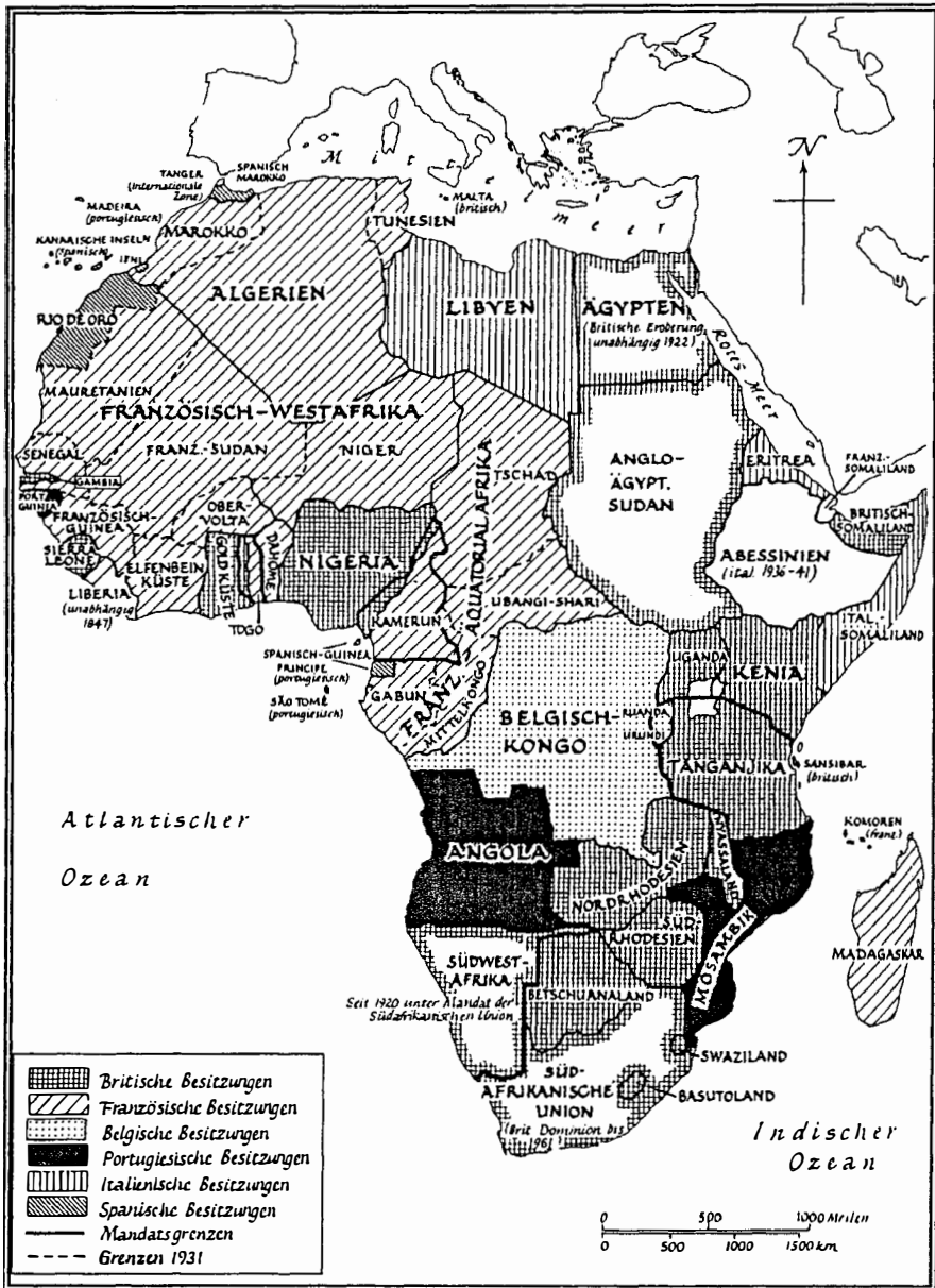
Abb. 1: Kolonialgrenzen