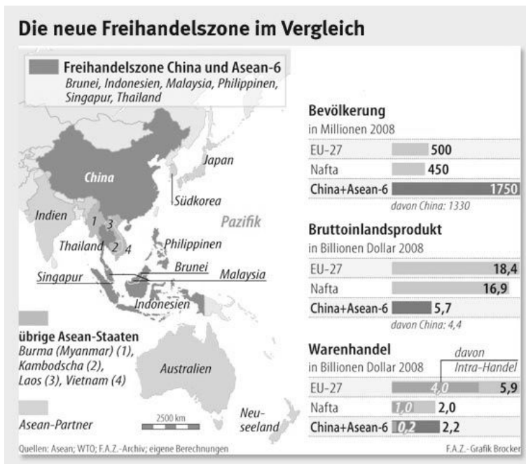
Abbildung 1: China-ASEAN-Freihandelszone

Euro als derzeit noch zweitwichtigster Weltreservewährung 9 erwächst somit jenseits des US-Dollars ein weiterer Konkurrent. Da die zukünftig wachstumsstarken Regionen der Weltwirtschaft nicht in Westeuropa oder den USA liegen werden, dürften sich in den kommenden Jahren und Jahrzehnten die Gewichte weiter zugunsten der BRICS-Länder verschieben. Daran würden die jeweiligen bilateralen Freihandelsabkommen zwischen den Vertretern der Triade, also den USA, Japan und der EU, im Kern nichts ändern können, sollten sie denn demnächst zustande kommen. Chinas ungebremsster Rohstoffhunger zieht alle Länder, die ihnen Rohstoffe liefern, in seine wirtschaftliche und politische Abhängigkeit. Das dürfte bereits dann relevant werden, wenn sich die aktuellen Zahlungsbilanzkrisen in Indien und in Brasilien weiter verschärfen. Wird dann der IWF oder der jetzt gegründete Beistandsfonds der BRICS-Staaten für Finanzhilfen in Anspruch genommen werden?