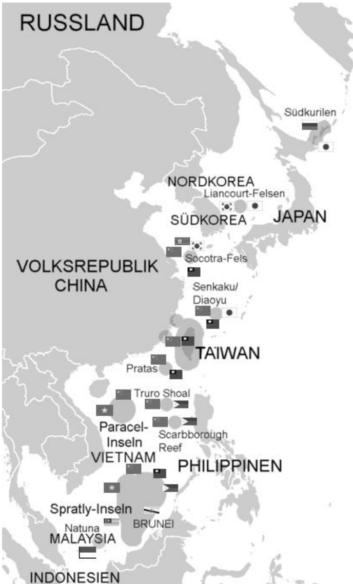
Abbildung 2: Territorialkonflikte in Ost- und Südostasien, in die China involviert ist