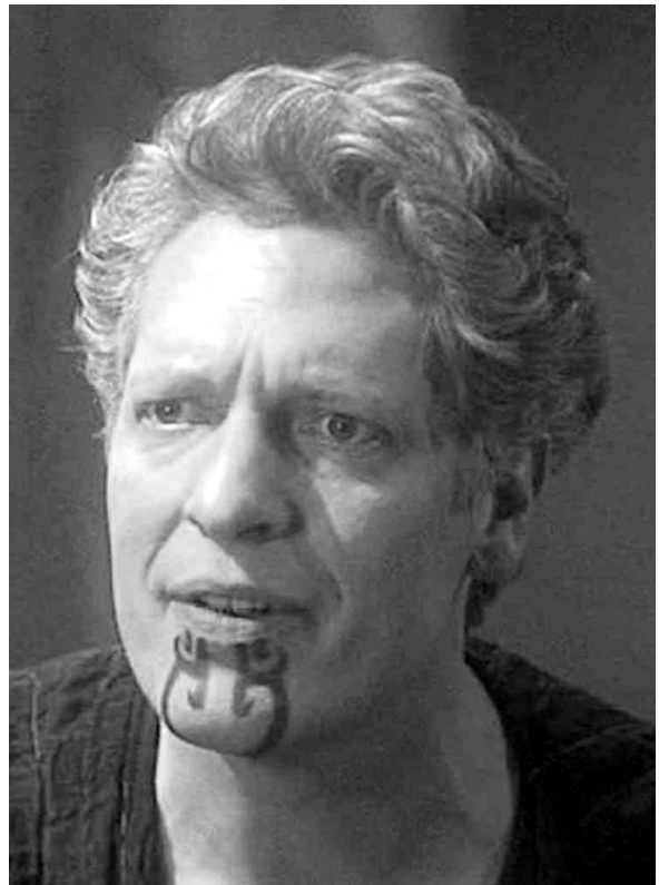
Abb. 1: Ein Außerirdischer namens Zobral mit seiner Kinn-tätowierung (Ausschnitt einer Standbildaufnahme aus Star Trek Enterprise 2002).

Das zuvor angesprochene Tattoo aus "Star Trek" ist allerdings nicht mit jeglicher kauae -Tätowierung in Übereinstimmung zu bringen, da es auf Neuseeland unterschiedliche Ausformungen von ihr gab. Ein mit der Tätowierung im Film vergleichbarer Grundtypus einer kauae ist jener dem Simmons (1999: 119) bescheinigt, mehr oder weniger wie der Buchstabe "M" auszusehen, und der in der Vergangenheit nachweislich auch von vielen Maori-Frauen getragen wurde. So zeigt z. B. die von Gottfried Lindauer porträtierte Maori-Frau Pare Watene (Abb. 2) in der Linienführung ihres kauae -Musters recht auffällige Übereinstimmungen mit Zobrals Kinn-tätowierung. Allerdings ist – genauso wie