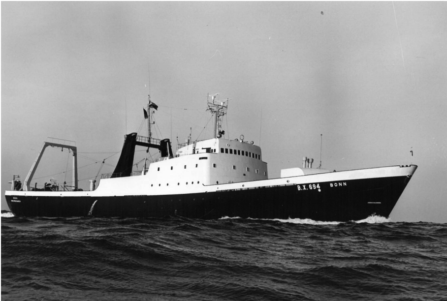
Abb. 1: Heckfänger FMS BONN, gebaut 1964 bei der Seebeck-Werft in Bremerhaven und 1974/75 für das MEXAL-Projekt eingesetzt.

von Brandt, ein führender Mitarbeiter der BFA, „höchstmögliche Erträge bei geringst möglichem Aufwand zu erhalten.“ 41