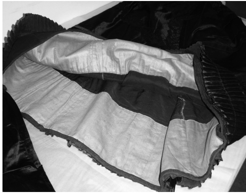
Abb. 3: Rock (um 1900) (Leicestershire County Council Museum Service, L.C 299.1959).

Ausbesserung erfolgte mit dem gleichen Stoff, aus dem auch das übrige Kleid genäht worden war. Augenscheinlich hatte man Stoffreste beiseite gelegt. Von den untersuchten Kleidungsstücken haben insgesamt 33 Prozent größere Nähte und 42 Prozent größere Säume oder Blenden, als es gegenwärtig üblich ist – ein Beispiel hierfür ist in Abbildung 3 wiedergegeben. Hier sollte der breite Innensaum offenbar eine längere Lebensdauer bewirken.