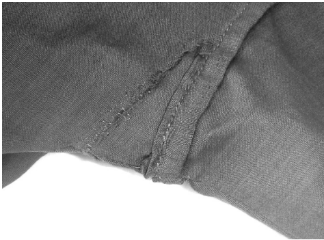
Abb. 2: Achselbereich eines Kleides (um 1914) (Leicestershire County Council Museum Service, L.C 739.1980).

In diesem Zusammenhang sollte auch die Funktion „anpassungsfähiger“ Nähte berücksichtigt werden: Dies sind Nähte, die zur damaligen Zeit „strategisch“ ausgewählt, oftmals nicht fertig vernäht wurden und in denen der Stoff nicht beschnitten wurde, um eine Erweiterung oder Verkleinerung des Kleidungsstückes, die weder dessen Passform noch Gestalt verändern sollte, ex post zu ermöglichen. Im Falle eines Mieders wären dies die Nähte an den Schultern und unter den Achseln. Die Ausführung dieser Nähte, zeitgenössisch als „fitting seams“ bezeichnet, wird in einem britischen Schneiderhandbuch folgendermaßen beschrieben: „tack the underarm and shoulder seam on the right side, and try on the shirt, make any necessary alterations and corrections [...] if the shirt is too tight across the chest, let it out at the underarm seam (another fitting seam) and draw down the front shoulder towards the armhole“. 16 Andere in den untersuchten Kleidungsstücken aufgefundene Reparaturtechniken zeigen die nachträgliche Einfügung eines neuen oder auch bereits verwendeten Stoffstückes, welches eine gestopfte Stelle verstärken oder nach der Ausbesserung eines Risses die genähte Stelle entlasten sollte. Abbildung 2 zeigt ein Kleid, bei dem im Achselbereich ein dreieckiges Stück diese Zwecke erfüllte. Dieses Beispiel legt auch nahe, wie stark bereits bei der Anfertigung eines Kleidungsstückes eine mögliche spätere Reparatur im Blick behalten wurde: Die