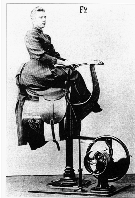
Abb. 1: Zanderapparat F2, „Erschütterungen im Reitsitz“, auch „Trabapparat“ bezeichnet. Mit dieser 180 Schwingungen pro Minute erzeugenden Zandermaschine sollte – wie beim Reiten – der gesamte Körper erschüttert werden. Eingesetzt wurde sie u.a. zur Anregung des Verdauungsapparats.

werk [...] der manuellen Gymnastik eine Kompliziertheit zumutete, die in Ausführung und Nomenklatur in ihrer Weise an die Tabulatur mittelalterlicher Meistersänger erinnert. In diese Zustände fuhr die Zander’sche Erfindung wie ein Blitzstrahl hernieder, aber nicht um zu zerschmettern, sondern nur aufzurütteln.“ 15