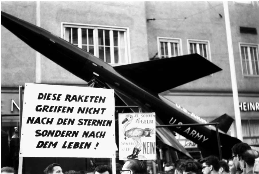
Abb. 4: Demonstration gegen die Premiere des Films Wernher von Braun – Ich greife nach den Sternen, München, 19.08.1960

fenen Brief an von Braun heißt es: „Sie wußten, daß Ihre Raketenkonstruktionen, damals, als Sie für die braunen Teufel arbeiteten, zur Massentötung bestimmt waren. ... Sie wissen, daß Ihre Raketenkonstruktionen heute, da Sie als Amerikaner für die US-Armee arbeiten, ebenfalls zur Massenausrottung verwendet werden können.“ 20