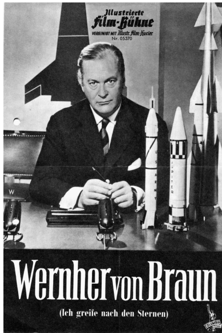
Abb. 3: Filmprogrammheft Wernher von Braun. Ich greife nach den Sternen (Illustrierte Film-Bühne, Nr. 5370) München 1960. Dokumentationsstelle KZ-Gedenkstätte Mittelbau-Dora.

Dora-Prozess bestätigte von Braun 1969, dass er bereits während des Ausbaus der Stollenanlage zum Mittelwerk im Sommer 1943 den Stollen besichtigt und auch dort untergebrachte Häftlinge gesehen hatte. 8 Weiterhin belegt ein Brief von Brauns an den Direktor der Mittelwerk GmbH, Albin Sawatzky, vom 15.08.1944, dass von Braun im Konzentrationslager Buchenwald bei der Auswahl von Zwangsarbeitern für Dora beteiligt gewesen ist. 9