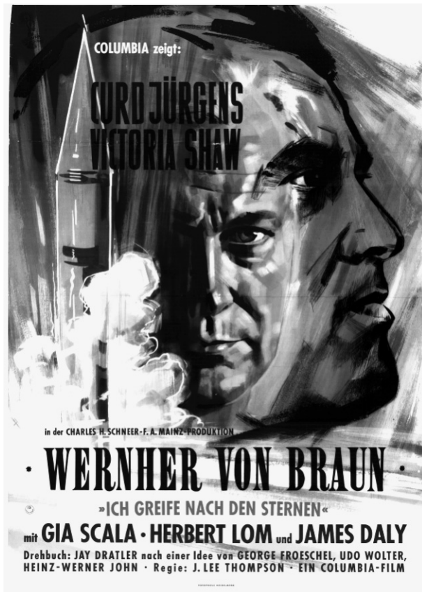
Abb. 2: Filmplakat Wernher von Braun – Ich greife nach den Sternen , 1960.

Der Film Wernher von Braun entpuppt sich in diesem Sinne als eine recht vollkommene Deckgeschichte: Die „Episode“ des Konzentrationslagers Mittelbau-Dora fehlt vollständig. An die Bombardierung Peenemündes schließt übergangslos die Entscheidung der meisten deutschen Ingenieure an, sich auf die amerikanische Seite zu schlagen. Anderthalb Jahre der Produktionsvorbereitung und der Raketenproduktion im Mittelwerk werden ausgeblendet. Wernher von Braun – selbst niemals angeklagt – hat als Zeuge im Rahmen des Dachauer Dora-Prozesses 1947 eingeräumt, „etwa 15 bis 20 mal“ in den Stollen gewesen zu sein. 7 In seiner Zeugenaussage zum Essener