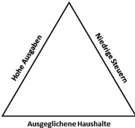
Abbildung 1: Das strategische Trilemma der Fiskalpolitik

zugleich erreicht werden können, sind die Parteien gezwungen, eines den anderen beiden unterzuordnen. Bildlich gesprochen besetzen sie mit ihrem politischen Programm eine Ecke des in Abbildung 1 skizzierten Dreiecks. Eine solche Prioritätensetzung wird im Folgenden als die „fiskalische Strategie“ einer Partei bezeichnet.