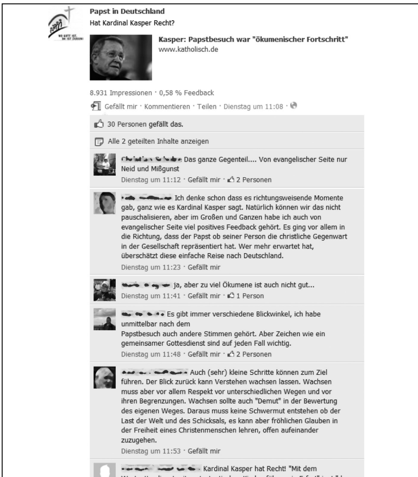
Abb. 2: Diskussion auf der Facebook-Seite am 11. Oktober 2011.

Auf der Seite waren sehr unterschiedliche Menschen engagiert: Vom wahren Papstfan über kritische Christen bis zu Papst- und Kirchengegnern waren sehr verschiedene Meinungen vertreten. In der Regel haben sich aber diese sehr unterschiedlichen „Fans“ an die Gepflogenheiten der Kommunikation gehalten. Nur wenige User muss-