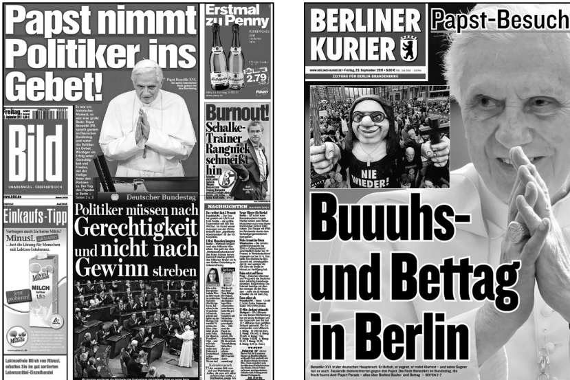
Der Papst spricht im Bundestag, Gegner protestieren (Titelseiten vom 23.9.).

Überhaupt achtete man auf Ausgeglichenheit: Mehrfach schaltete die ARD vor und nach der Papstrede auf den Potsdamer Platz, wo sich Gegendemonstranten versammelt hatten. Jedoch waren es, wie der Reporter wiederholt berichten musste, nicht die angekündigten 15 000 Papstgegner, sondern nur 2000. Die ARD befragte dann noch etliche Parlamentarier unmittelbar nach der Ansprache Benedikts – allerdings nur beiläufig zu den Inhalten der Rede. Wichtiger schien vielmehr die Frage, was davon zu halten sei, dass der Grünen-Abgeordnete Christian Ströbele den Plenarsaal verlassen hatte. Selbst der grüne Parteifreund Volker Beck zuckte da mit den Schultern.