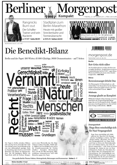
Die schwierige Reise Benedikts XVI. (Titelseiten vom 19. und 23. 9.)

lässt die Deutschen vom Glauben abfallen“ machten die Hamburger bereits eine Woche vorher (Nr. 38 vom 19.9.2011) auf, womit ja – aus ihrer Sicht zumindest – alles kürzest möglich gesagt gewesen wäre. Unter „Der Fremde“ stimmte die Redaktion dann auf 14 Seiten im Innenteil, darunter ein vierseitiges Interview mit Hans Küng über die „Putinisierung der Kirche“, in der gewohnt und zu erwartenden kritisch-polemischen Art und Weise auf das Ereignis ein und spiegelten dieses vor dem Hintergrund der großen Misere der katholischen Kirche in Deutschland. In eindeutiger Sympathie für die unverständenen „Reformkatholiken“ prophezeite das Magazin ein Aufeinanderprallen zweier inkompatibler Welten. Die Euphorie jener ebenso unvergessenen wie unzutreffenden „Bild“-Schlagzeile von 2005 „Wir sind Papst“ (Springer verhüllte mit einem 65 Meter langen Poster dieser Titelseite während des Papstbesuchs sein Verlagshaus) sei verfliegen, der erhoffte Aufbruch ausgeblieben. Stattdessen gewannen Erzkonservative an Einfluss. Auf Antworten der Kirche zu wichtigen Fragen könne die moderne Gesellschaft weiter (vergeblich) warten.