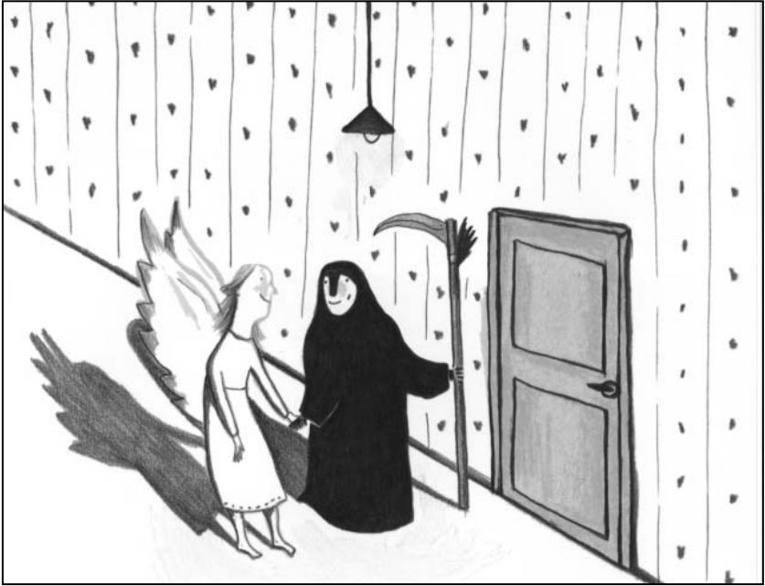
Abb. 4: Kitty Crowther: „Der Besuch vom kleinen Tod“