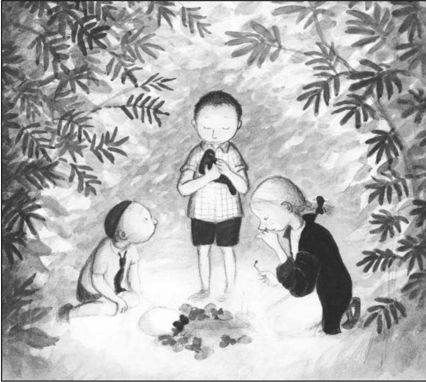
Abb. 8: Ulf Nilsson/Eva Eriksson: „Die besten Beerdigungen der Welt“