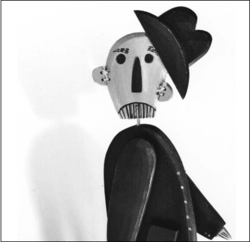
Abb. 6: „Geschichte von der Auferstehung des Papageis“

Nachsatzpapier blättert: Hier ist ein etwas derangierter kleiner Knochenmann mit verrutschtem Hut zu sehen, der ein wenig an die mexikanischen Zuckerskelette anlässlich des dia de los muertos erinnert (vgl. Abb. 6). Wie in manchen Sagen (etwa bei Orpheus und Eurydike, wo dem verzweifelten Orpheus die Möglichkeit gegeben wird, seine geliebte Eurydike aus der Unterwelt zurückzuholen) verliert der Tod hier also seine Absolutheit, seine Unumkehrbarkeit – der Töpfer von Ceará kann den Tod aufheben, am Ende steht, anders als der Titel des Buches vermuten lässt, nicht eine Auferstehung im christlichen Sinn, sondern eine Aufhebung des Todes und damit ein Weiterleben.