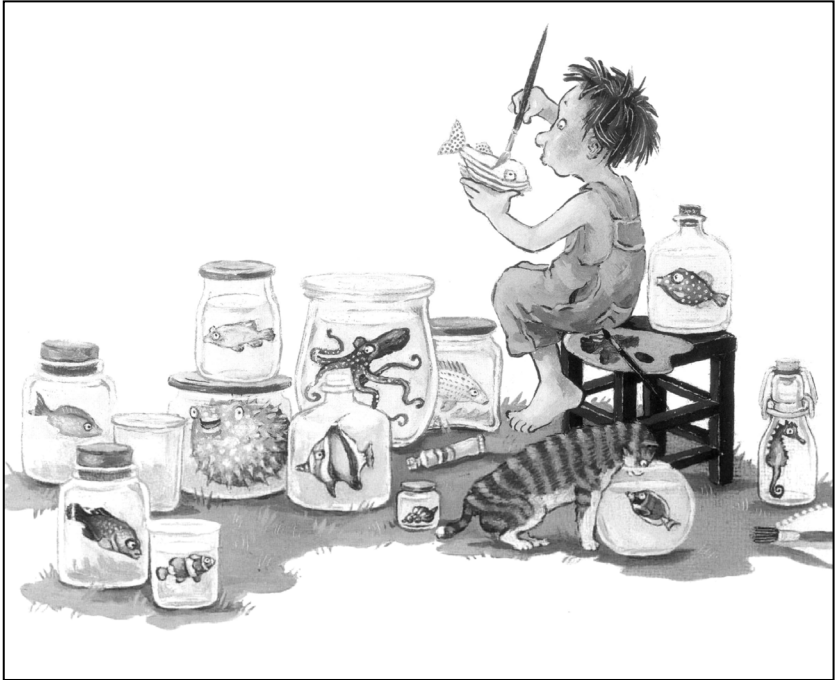
Abb. 3 aus Annette Swoboda: Der kleine Gott und die Tiere . Hamburg 2008.

sich die kindliche Protagonistin per Walkie-Talkie mit ihren Sorgen an Gott – und erhält tatsächlich Antwort von einer brummigen Männerstimme. Sie stellt fest, dass Gottes Stimme zu einem älteren Mann mit Alkoholfahne gehört, der im selben Haus wie sie wohnt. Obwohl er seinen weinseligen Scherz bald bereut, bleibt ihm nichts anderes übrig, als sich auf die Fragen der Kleinen einzulassen. Doch allen Schwierigkeiten zum Trotz: Karo stellt fest, dass seine Göttlichkeit weniger in seiner Allmacht liegt als in der Bereitschaft, sich mit ihr und ihren Problemen zu beschäftigen. 11