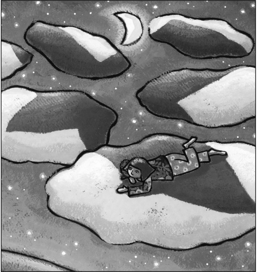
Abb. 4 aus Regine Schindler: Im Schatten deiner Flügel. Psalmen für Kinder . Illustriert von Arno. Düsseldorf 2005.

sprünglich gesungenen Texte der Psalmen lassen sich als eine Art „Gebetsformular“ in jede Zeit und damit auch in den heutigen Kinderalltag übertragen. Während in den üblichen Kinderbibeln die Psalmen oft ausgespart werden, hat Regine Schindler unter dem Titel „Im Schatten deiner Flügel“ 15 ein Psalmenbuch für Kinder herausgegeben. Die bildhafte, anschauliche Sprache dieser Texte bietet vielerlei Möglichkeiten, eigene Gottesbilder zu finden oder neue Gottesbegriffe kennen zu lernen, Dinge in Worte gefasst zu finden, die man selbst