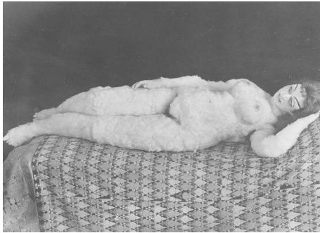
Abb. 3: Oskar Kokoschkas Alma-Puppe, 1919.

Heutzutage sind lebensechte High-End-Sexpuppen, sogenannte RealDolls , auf dem Markt, die teilweise bereits mit modernen technischen Features ausgestattet sind. Da bisherige und aktuelle Entwickler und Produzenten 13 von Sexrobotern allesamt aus der Silikonpuppenindustrie kommen, ist es naheliegend, dass Sexroboter bis dato lediglich als technische und tech-