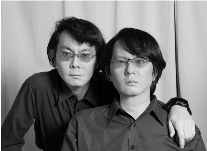
Abb. 2: Wer ist wer? Der japanische Robotiker Dr. Hiroshi Ishiguro und sein androider Doppelgänger Geminoid HI-4 (entwickelt von der Universität Osaka).

Androide 11 sind eine spezielle Form humanoider Roboter, die dem Menschen in ihrer Gestalt besonders stark ähneln (vgl. Wikipedia, o.J., a; o.J., b). So können sie etwa auch lebensechte Nachbildungen eines real existierenden Menschen darstellen, wie das Beispiel des Robotikers Hiroshi Ishiguro zeigt, der sich mit dem Geminoid HI einen robotischen Doppelgänger erschuf (Abb. 2). Androide sind, ebenso wie andere humanoide Roboter, häufig Gegenstand von Science-Fiction-Literatur und -Filmen. Außerhalb von Forschung, Messen und der Sexroboter-Industrie sind sie in Europa jedoch bisher kaum im Einsatz.