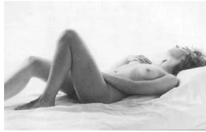
Abb. 8: Zentrales Bild auf Seite 5 von Let's talk about Sex – Ein Sex-Heft für Jugendliche

Neben der farbenfrohen und bilderreichen Gestaltung unterscheidet sich das Heft auch dadurch von klassischer Sach- oder Aufklärungsliteratur, dass neben sachlichen Informationen unkommentierte Erfahrungsberichte und Meinungsbilder von Jugendlichen und jungen Erwachsenen eingearbeitet sind. Häufig werden von den Verfasser:innen Fragen gestellt, die allerdings unbeantwortet bleiben. Getreu dem Leitspruch »eine gute Frage ist besser als zehn schlechte Antworten« wurden beispielsweise auf den Seiten 22/23 ausgewählte Fragen zusammengetragen, »die Jugendliche zum Thema Sexualität gestellt und diskutiert haben« 1549 . Die einleitende Frage »Was würdest du antworten?« 1550 stiftet zur Auseinandersetzung mit ausgewählten Aspekten menschlicher Sexualität an. Dabei werden Gesichtspunkte der Sexualerziehung besprochen wie das erste Mal, Liebe und Gefühle, Verhütung von Schwangerschaft und Krankheiten (HIV wird dabei gesondert auf der letzten Doppelseite behandelt) sowie