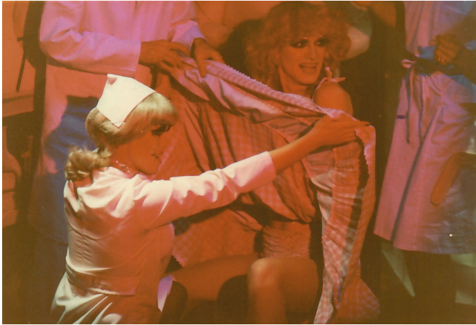
Abb. 4: Szene aus dem Showprogramm des Chez Romy Haag (vermutlich 1978), hier zur Musik von The Who: It's a boy, Mrs. Walker, It's a boy.