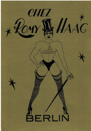
Abb. 1: Werbepostkarte, vermutlich 1975.