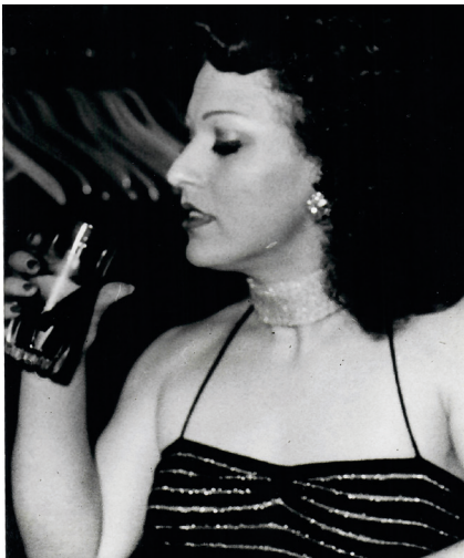
Abb. 3: Die Autorin an ihrem Arbeitsplatz im Chez Romy Haag , 1979.