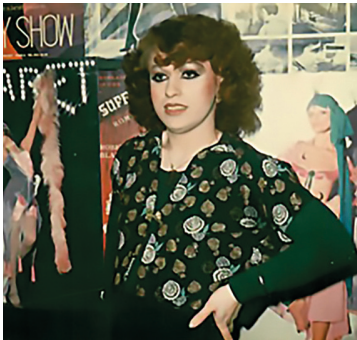
Abb. 5: Im Chez Romy Haag , 1977.