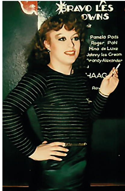
Abb. 6: Im Chez Romy Haag , 1978.