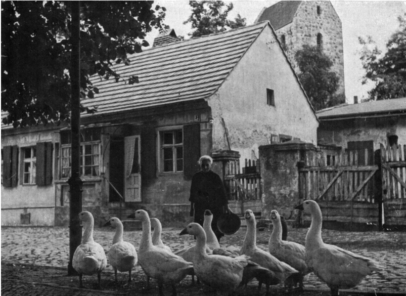
Abb. 1: Ihre Omama 1951 vor dem Haus, in dem sie und ihr Papa geboren wurden. Die Gänse gehörten der Oma.