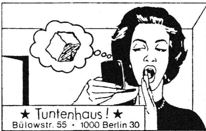
Abb. 9: Klebezettel, im Tuntenhaus produziert und auf den Westberliner Hauswänden platziert.