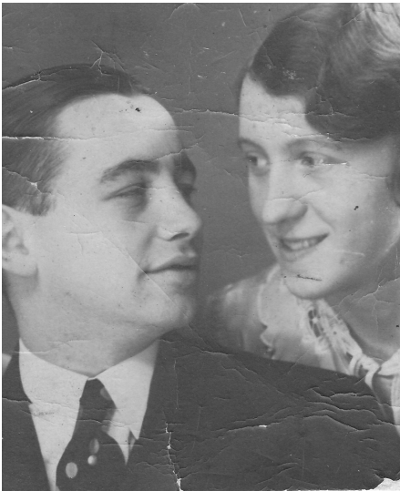
Abb. 2: O mein Papa! Rechts daneben: Mutti um 1940.