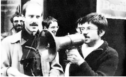
Abb. 7: F. und S. treffen sich auf höchster politischer Ebene 1978 bei einer Straßendemo.

AKEO und die erste international koordinierte Aktion der frisch in England gegründeten IGA, es sah auch fast so aus wie ein zarter Neuanfang des erwähnten prekären Liebesdreiecks, diesmal auf der Straße.