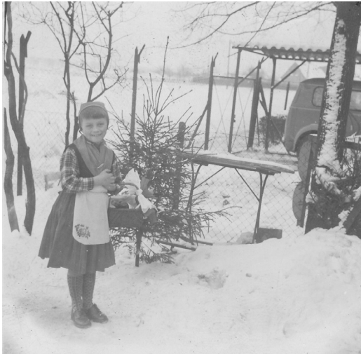
Abb. 3: Von Mutti für den Kinderfasching 1956 als Rotkäppchen kostümiert.