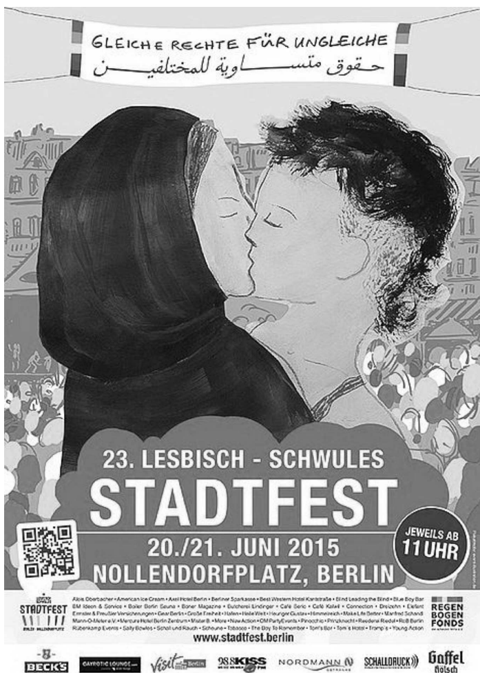
Abb. 2: Plakat vom lesbisch-schwulen Stadtfest aus dem Jahr 2015

Dieser erste Schritt, auch die lesbische Identität offensichtlich zu repräsentieren und ein Zeichen gegen Rassismus zu setzen, wurde zunächst von mehreren LSBTIQ*-Organisationen begrüßt, denn auf dem Plakat war ein sich küssendes Frauenpaar abgebildet. Kritisiert wurde jedoch, dass das Paar, das als lesbisch wahrgenommen werden sollte, mit kul-