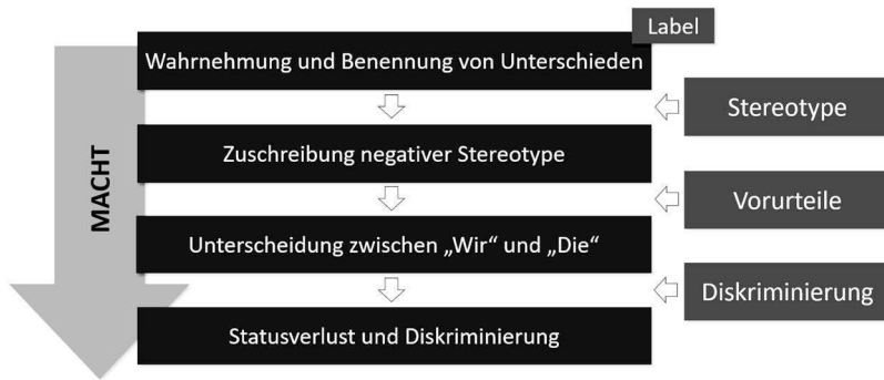
Abbildung 1: Stigmatisierungsprozess nach Link und Phelan (2001)

Bruce Link und Jo Phelan (2001) entwickelten basierend auf den Arbeiten von Goffman ein Modell des Stigmaprozesses, das ein dynamisches Gefüge von vier Prozessen innerhalb eines Machtverhältnisses annimmt (Abbildung 1).