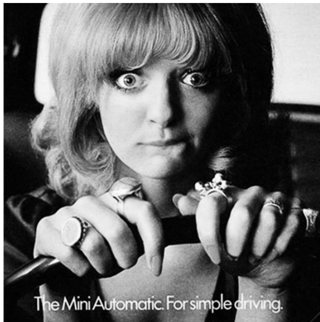
Abb. 4: Mini , Großbritannien, 1968

jedoch weitestgehend dieselben geblieben. 267 Nach wie vor steht die Hausfrau und Mutter im Fokus. Darüber hinaus wird verstärkt auf die junge und attraktive Frau als Werbebild gesetzt. Sie wird vollbusig und spärlich bekleidet oder als naiv und intellektuell beschränkt abgebildet. 268 In einer britischen Werbung der Marke Mini für ein Auto mit Automatikgetriebe ist eine nervöse Frau am Steuer zu sehen. In der Bildunterschrift heißt es: „For simple driving“ (Abb. 4). In Italien illustriert beispielsweise eine Bierwerbung der Marke Birra Peroni , wie Frauen häufig als „sexy Dekorationsobjekte“ eingesetzt werden (Abb. 5).