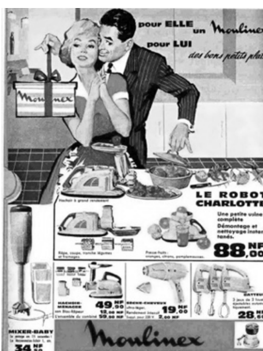
Abb. 2: Moulinex, Frankreich, 1950