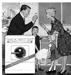
Abb. 1: Miele, Deutschland, 1961

Ziel der Frau an, den Haushalt zu führen und ihrem Ehemann ein wohl-schmeckendes Essen zu servieren. 254 Der Mann wird demgegenüber als selbstbewusster Geschäftsmann, Familienversorger oder abenteuerlustiger Draufgänger porträtiert. 255