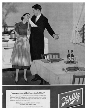
Abb. 3: Schlitz Brewing, Großbritannien, 1950

Werden Mann und Frau in einer Werbung abgebildet, nimmt in der Regel der Mann „die Machtposition der Werbedramaturgie“ ein und die Frau „belehrt oder berichtigt, wenn sie nicht gerade als schmückendes Beiwerk oder als Fachfrau im Haushalt eingesetzt wird“. 256 Steht die Frau im Mittelpunkt der Werbekampagne, geht es zumeist um die Optimierung des Haushalts oder des Familienlebens. 257 In einem Dr. Oetker -Werbefilm von 1954 heißt es beispielsweise: „Eine Frau hat zwei Lebensfragen: Was soll ich anziehen und was soll ich kochen?“ 258 Männer sind demgegenüber in Werbung für Genussmittel wie alkoholische Getränke oder Zigaretten zu sehen. Sie werden als gesellig, karrierebewusst, Experten oder als Ober-