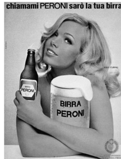
Abb. 5: Birra Peroni , Italien, 1965